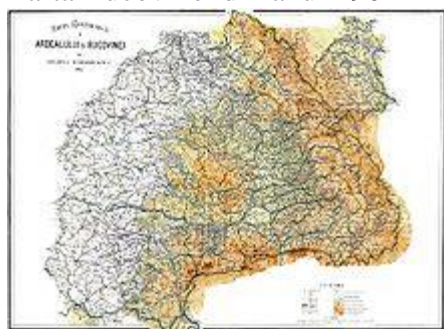
Harta regiunilor austro-ungare locuite de români

Teritoriul Bucovinei a făcut parte din Principatul Moldovei ; în 1774 , 10.442 km 2 din partea de nord-vest a Moldovei sunt anexați de către Imperiul Habsburgic [3] . Devine Ducatul Bucovinei în 1849 , unindu-se ulterior cu România la 15/28 noiembrie 1918 , pentru ca, pe 28 iunie 1940 , urmare a Pactului Ribbentrop-Molotov , partea sa de nord împreună cu Basarabia și Ținutul Herța , să fie ocupate de U.R.S.S. . În 1991 , după destrămarea U.R.S.S. , nordul Bucovinei și Ținutul Herța devin parte a Ucrainei (regiunea Cernăuți ).